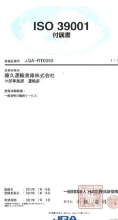
《ISO39001マネジメントシステム登録証》 《適用規格》ISO39001:2012