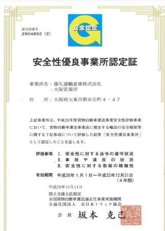
《安全性優良事業所認定証》 荷主企業が安全性の高い事業者を選びやすくするため、 全国貨物自動車運送適正化事業実施機関(全日本トラック協会) が40の評価項目を設定し、輸送の安全の確保に積極的に 取り組んでいる事業所を認定する制度です